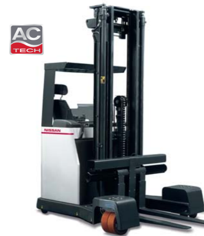
UFS 2.0 - 2.5 tonnellate, AC