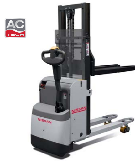
PSL/PSD 1.2 - 1.6 tonnellate, AC