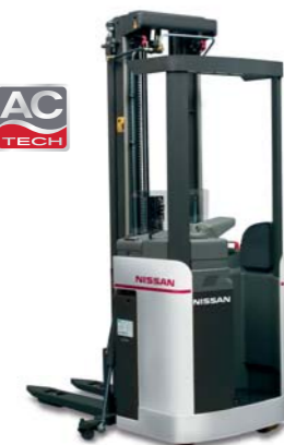
AJN/ASN 1.6 - 2.0 tonnellate, AC