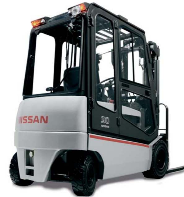
Serie QX 80 volt 2.0 - 3.0 tonnellate, DC