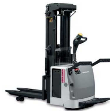
TS 1.2 - 1.4 - 1.5 tonnellate