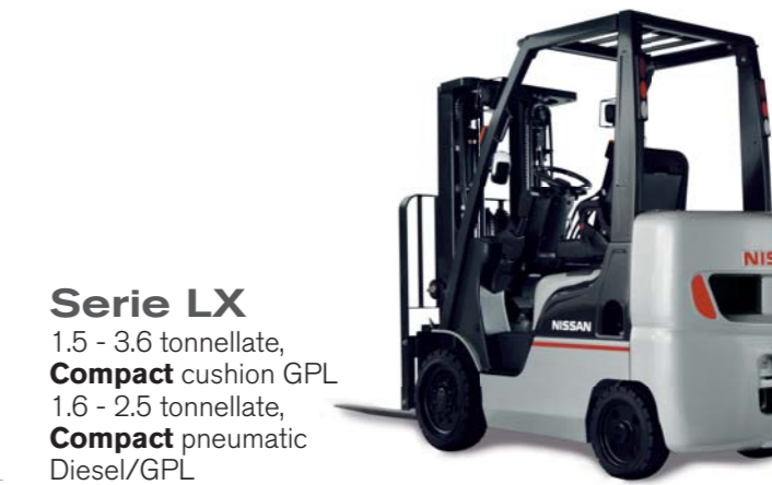
Serie LX 1.5 - 3.6 tonnellate, Compact cushion GPL 1.6 - 2.5 tonnellate, Compact pneumatic Diesel/GPL