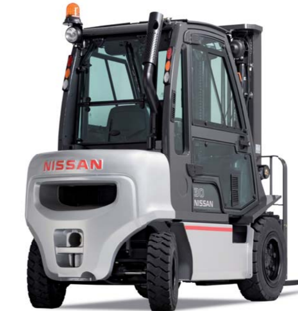
Serie DX 1.5 - 3.2 tonnellate, GPL & Diesel