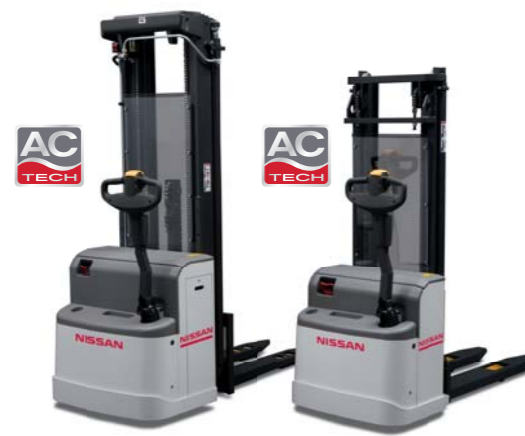
PSH 1.6 - 2.0 tonnellate, AC