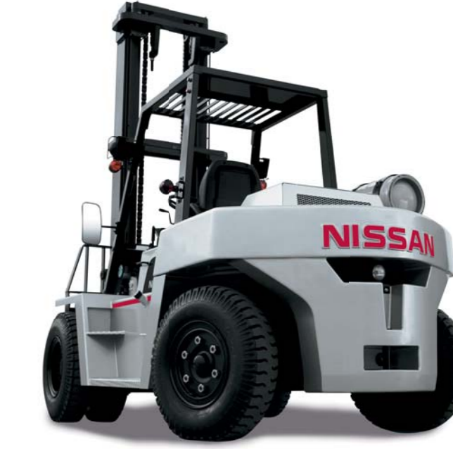
Serie FX5 3.5 - 7.0 tonnellate, GPL & Diesel