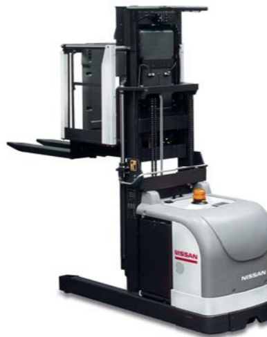
OPM 1.0 tonnellate