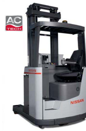
UNS/UHS 1.4 - 1.6 - 2.0 - 2.5 tonnellate, AC