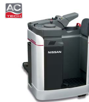
ALL 2.0 tonnellate, AC