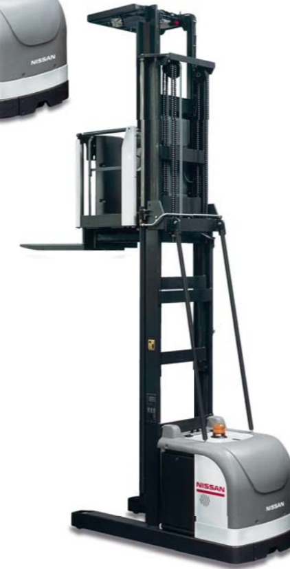
OPH OPC OPS 1.0 tonnellate