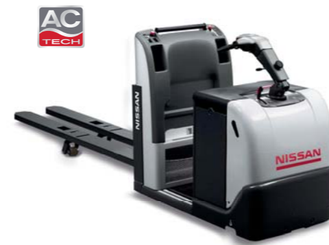
PPF/PPL/ PPS 1.2 - 2.0 - 2.5 tonnellate, AC