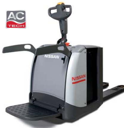
PLP 2.0 - 2.5 tonnellate, AC