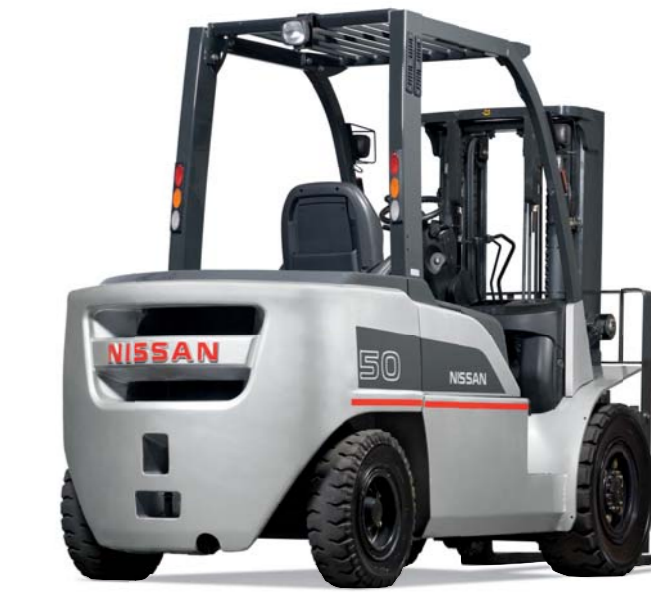
Serie GX 3.5 - 5.0 tonnellate, GPL & Diesel