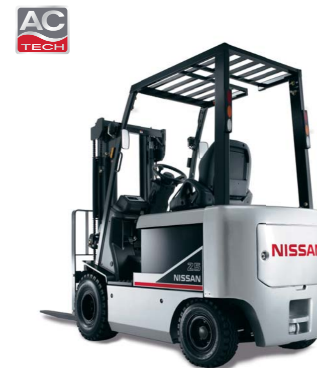
Serie BX 48 volt 1.5 - 3.0 tonnellate, Cushion AC 1.5 - 2.5 tonnellate, Pneumatic AC