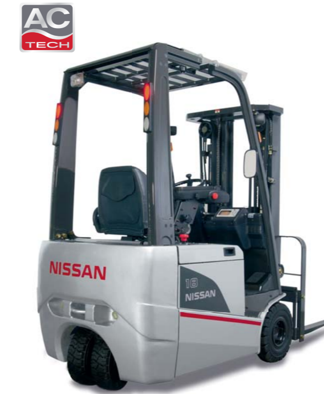
Serie TX 48 volt 1.25 - 2.0 tonnellate, AC