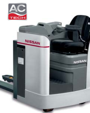
XLL 2.0 tonnellate, AC