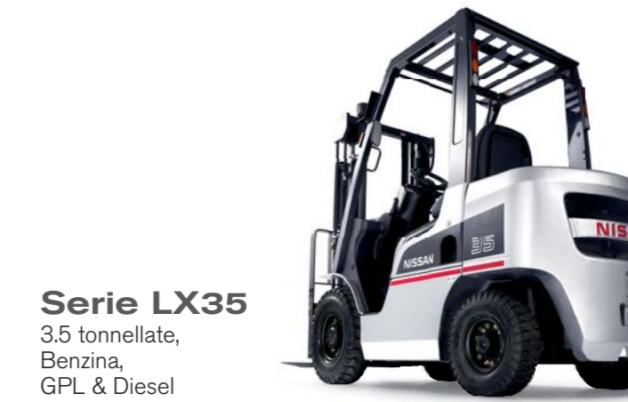
Serie LX35 3.5 tonnellate, Benzina, GPL & Diesel