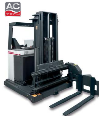
URF 1.2 - 1.5 tonnellate, AC