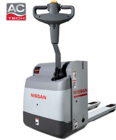
PLL 1.4 - 1.8 - 2.0 tonnellate, AC