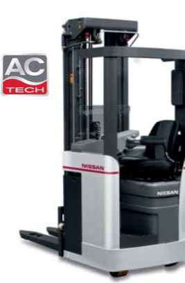
XJN/XSN 1.6 - 2.0 tonnellate, AC