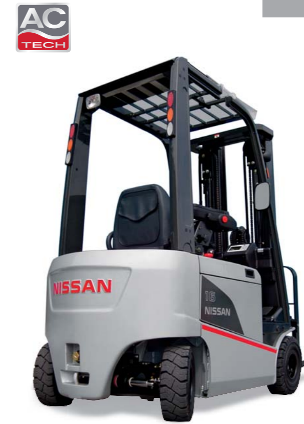
Serie TX4 48 volt 1.6 - 2.0 tonnellate, AC