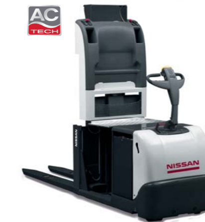
PPC/PPD/ PPS 1.2 - 2.0 - 2.5 tonnellate, AC