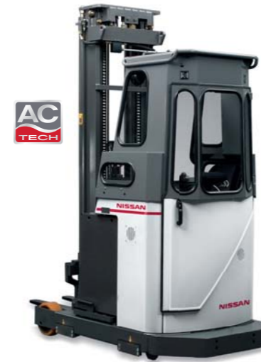
USS 1.4 tonnellate, AC